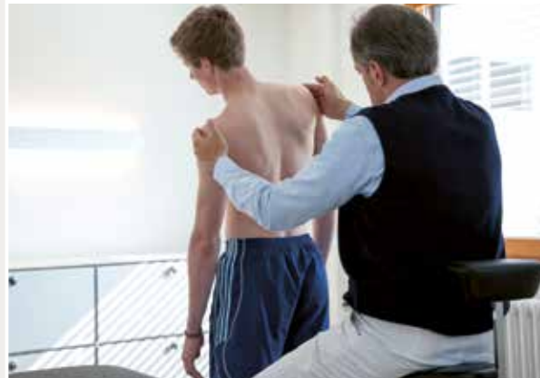
Jeder Patient erhält seinen individuellen Therapieplan

Weil Körper, Seele und Geist eine Einheit bilden, die stets individueller Behandlung bedarf, betrachten wir die