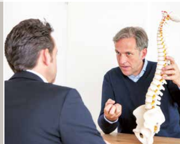
Ausführliches Gespräch zwischen Patient und Arzt

Ihr Team des Grönemeyer Instituts Hamburg